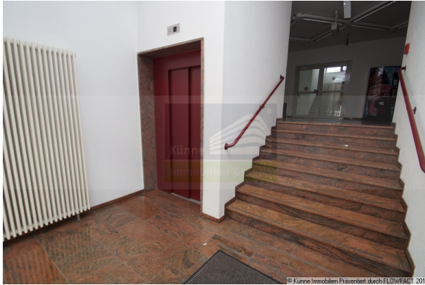
Eingangsbereich mit Lift